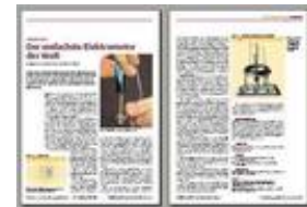
archivo pdf, 290 kB

De la revista "Physik in unserer Zeit", 35º Año, Edición Nr. 6, Noviembre 2004, © 2004 Wiley-VCH Verlag GmbH & Co. KGaA, Weinheim.