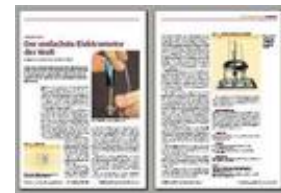
fichier PDF, 290 kB

Nous ne voulions pas vous priver d'une telle expérience et avons obtenu l'aimable autorisation des éditions Wiley-VCH de Weinheim de publier cet article (en allemand) sur notre site.