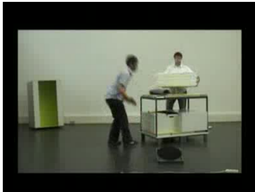
Video, 4.9 MB